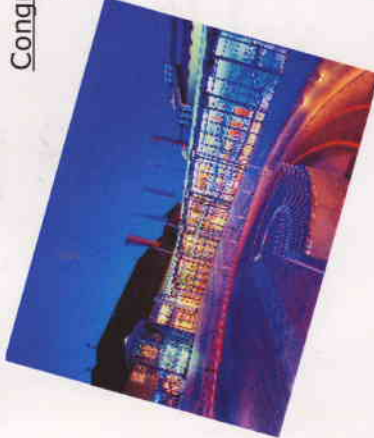
Großer Saal (960 m 2 )