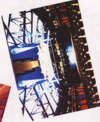
Europa-Saal (425 m 2 )